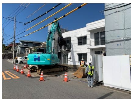
2020年(令和2年) 某社宅解体工事 (アスベストレベル1撤去)