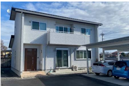
2014年(平成26年) T様邸 新築工事