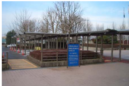
2008年(平成20年) 宇都宮市文化会館 有蓋通路新設工事