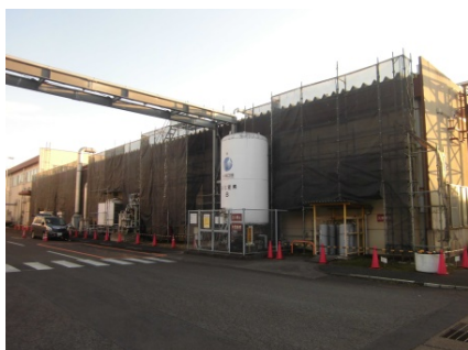
2020年(令和2年) 日本ピストンリング栃木工場 軒樋及び外壁改修工事