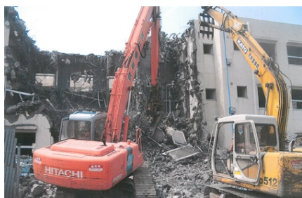
2010年(平成22年) 日本生命宇都宮荘建屋解体工事