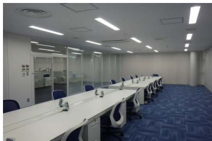
2017年(平成29年) 宇都宮市内事務所 改修工事