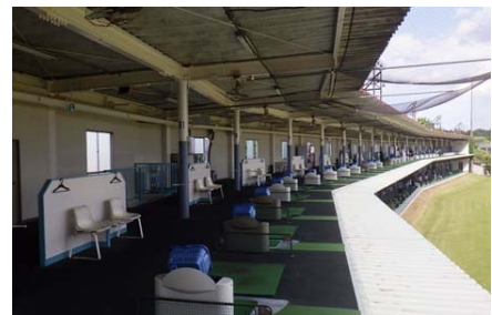
2017年(平成29年) 岡本台ゴルフ練習場2階鉄骨塗装工事