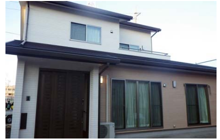
2013年(平成25年) S様邸 新築工事