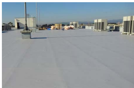
2019年(令和元年) ミットヨ2工場 屋上防水更新工事