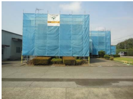
2020年(令和2年) 西川レベックス 事務所棟リニューアル工事