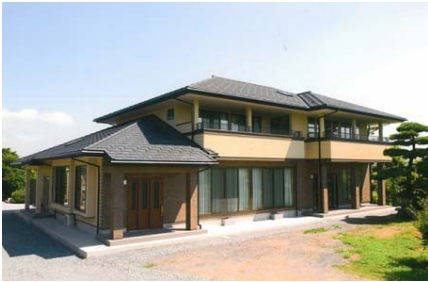
2012年(平成24年) G様邸 新築工事