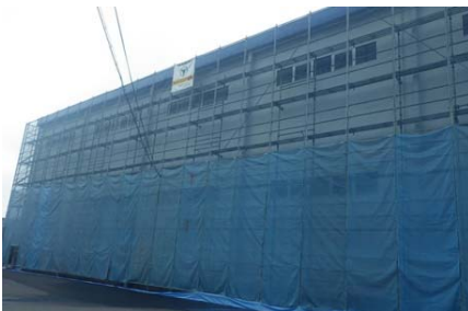
2016年(平成28年) 西川産業 宇都宮センター本館外壁改修工事