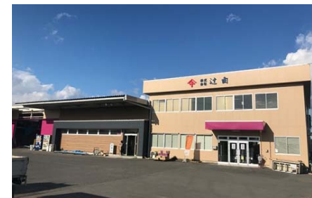
2020年(令和2年) 辻由 OKホーム支社改修工事