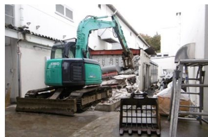
2019年(令和元年) ミットヨ コンプレッサー室解体工事