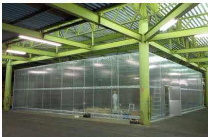
2018年(平成30年) 西川産業 古河センター室内テント設置工事