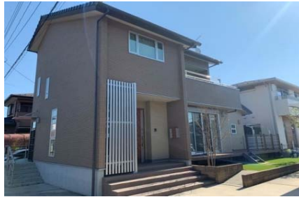
2013年(平成25年) O様邸 新築工事